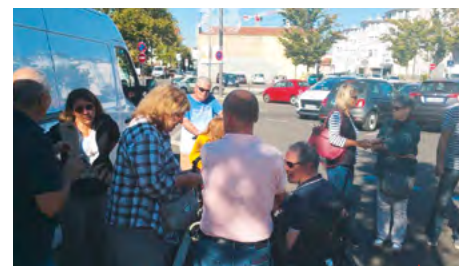
Groupe de travail accessibilité place Salengro

La campagne a officiellement démarré le 3 octobre. L'inscription se fait cette année en ligne sur www.wille-saint-priest.fr , rubrique vie citoyenne / conseils de quartier. Vous trouverez toutes les informations sur le magazine Couleurs du mois d'octobre.