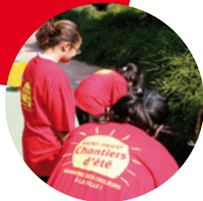
Les chantiers d'été, un dispositif ouvert aux jeunes de Saint-Priest.

Entre l'individu et les plus hautes instances politiques, il y a les élus des collectivités locales. Et ces élus de terrain que nous sommes savent bien à quel point, aujourd'hui, l'intérêt général n'est plus seulement celui du groupe mais aussi celui des générations à venir, à quel point l'action locale rejoint les préoccupations globales. À Saint-Priest, avec les San-Priots, nous proposons donc de conduire un agenda du 21 e siècle,