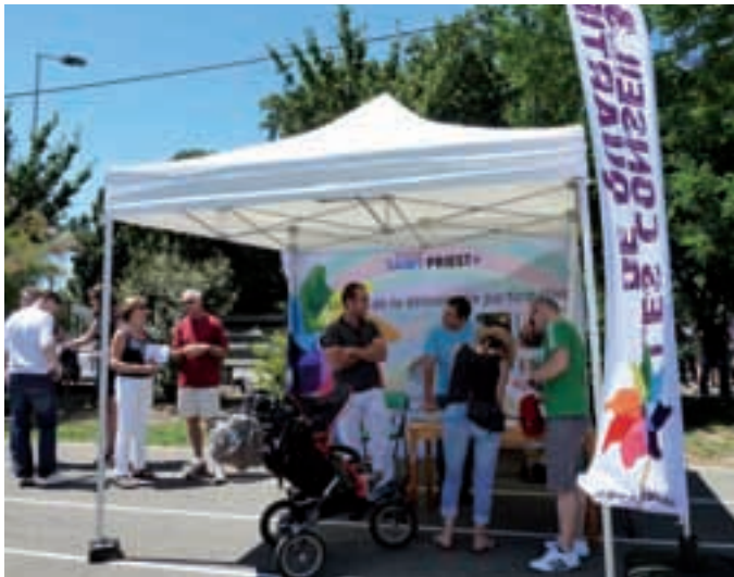
Stand du conseil de quartier lors de la kermesse de l'école Mi-plaine.