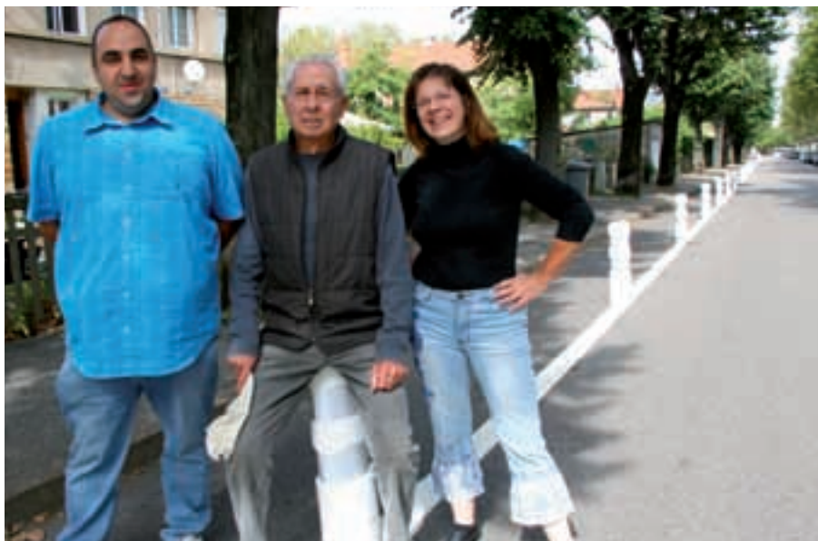
Les conseillers de quartier du groupe «plan de circulation» devant la voie piétonne de transition, l'une des nouveautés test qui sera au débat à l'assemblée du conseil de quartier.

«Mais en général nous sommes satisfaits des premiers