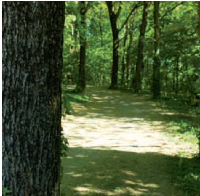
Sous les arbres, parc du Fort.

existants, la fermeture des poches de stationnements au Nord. En janvier 2012, le réaménagement suivra son cours avec le déplacement de l'aire de tir à l'arc, le long du gymnase Boris Vian, la création d'une aire de stationnement au Sud incluant les places actuelles, la réalisation d'une aire d'accueil du public, un parvis, des toilettes, une aire de jeux et des panneaux d'information. Enfin, à partir de mars 2012, une prairie sera aménagée au sud du parc pour les familles avec signalétiques, poubelles, tables de pique-nique et une ouverture dans la végétation le long de l'allée des Hêtres permettra de profiter d'une plus belle perspective sur le parc. Ces réaménagements à l'intérieur et autour du parc vont permettre aux San-Priotes de redécouvrir cet espace de nature privilégié au cœur de notre ville.