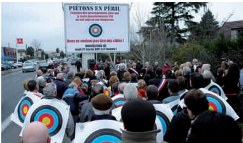
Manifestation pour la sécurisation de la route d'Heyrieux du 21 février 2011.

Les conseillers de quartier de Revaion, Centre-ville, Gare, Garibaldi, Bel-Air - Plaine de Saythe et les riverains de la route d'Heyrieux ont reçu un courrier du Maire début septembre listant les avancées significatives de la sécurisation de cette route. Un radar pédagogique sera placé après le rond-point des Meurières, suivi d'un plateau traversant (ralentisseur surélevé) en face de la station essence. Ce dispositif de prévention sera complété par un radar fixe et l'installation d'un deuxième plateau traversant à l'angle de la rue Simone de Beauvoir